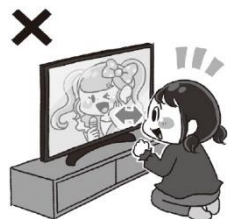
近い距離で テレビを見る