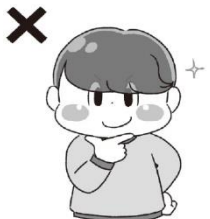
前髪が目にかかる