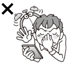
スマホやゲームの 長時間利用