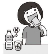
冷たいものばかり食べる・飲む