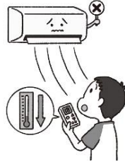
エアコンの設定温度を低くする