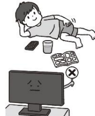
1日中ごろごろする